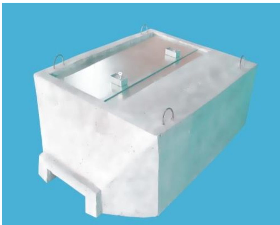
Zdjęcie studni z wbudowaną pokrywą stalową PWPB-2.

NINIEJSZY DOKUMENT ZAWIERA WAŻNE WSKAZÓWKI I OSTRZEŻENIA Z KTÓRYMI NALEŻY SIĘ BEZWZGLĘDNIE ZAPOZNAĆ PRZED PRZYSTĄPIENIEM DO WYKONYWANIA PRAC MONTAŻOWYCH