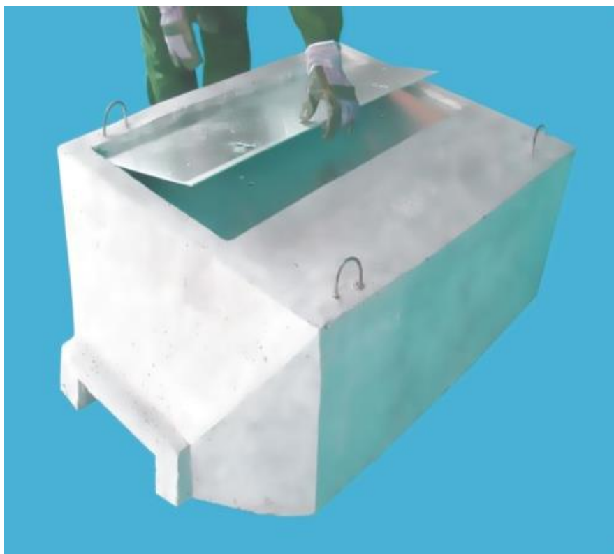
Zdjęcie studni podczas układania pokrywy górnej.